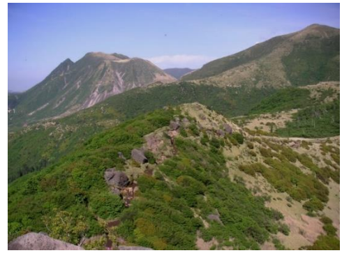
△沓掛山から久住山への縦走路。左奥は三俣山、右は墨生山

岳…韓国岳避難小屋…大 浪池最高点…えびの高原 ビジターセンター(計 4時間30分)＝えびの IC＝熊本IC＝赤水＝や まなみハイウェイ＝九重 牧ノ戸温泉【九重観光 ホテル泊】③＝長者原 …雨ヶ池…坊がつる… 法華院温泉…北千里浜 …久住別れ…△天狗ヶ