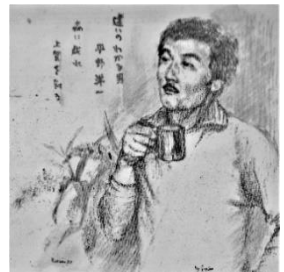
☺今年も平野ガイド・年男です☺