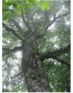
白神のシンボル・マザーツリー

1日目は大館能代空港から秋田白神の東、ブナ原生林と上部の高層湿原が美しい田代岳を歩き、藤里湯の沢温泉泊、2日目に秋田白神の主峰・藤里駒ヶ岳と岳岱ブナ原生林の後、釣瓶峠を越え西目屋村へ。3日目は青森白神の核心部・津軽峠から高倉森を往復。帰路、白神のシンボル・マザーツリー～巨木の径を歩く白神山地で最もブナ巨木と出合える山域を歩きます。4日目は嶽温泉から岩木山スカイライン8合目へ。津軽富士・岩木山を往復後、スカイライン中腹「巨木の森」に立ち寄り、岩木山中最も素晴らしいブナ森を逍遙、降り注ぐブナの精気を浴びながら森の広場で憩います。